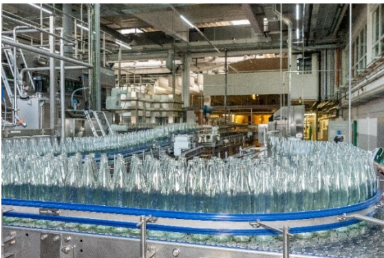
Neue Glas-Mehrweganlage in Bad Kissingen in Betrieb